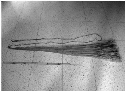
Fig. 2 - Esperver plegat

S'utilitza tant a la costa marítima com als rius, a peu eixut, endinsant-se a l'aigua o des de petites barques. El tipus d'esperver tradicionalment utilitzat als rius pirinencs, a jutjar pels exemplars que hem pogut veure, desplegat té un radi d'entre 1 i 1,3 metres, consta d'entre 120 i 160 boles de plom equidistribuïdes per tota la circumferència en grups de tres o de quatre i el seu pes eixut oscil·la entre dos i tres kilos. Cada grup de boles de plom està separat per una corda en ziga-zaga,